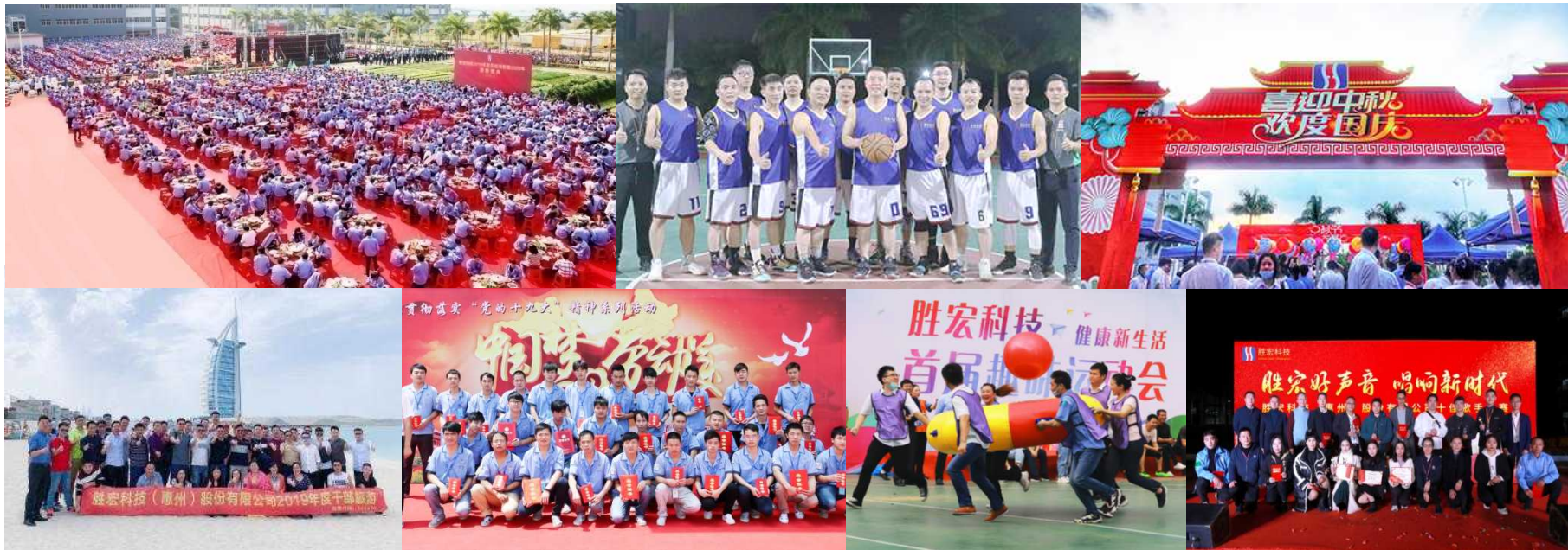
年终庆典 全厂旅游 节日活动 各类文体活动